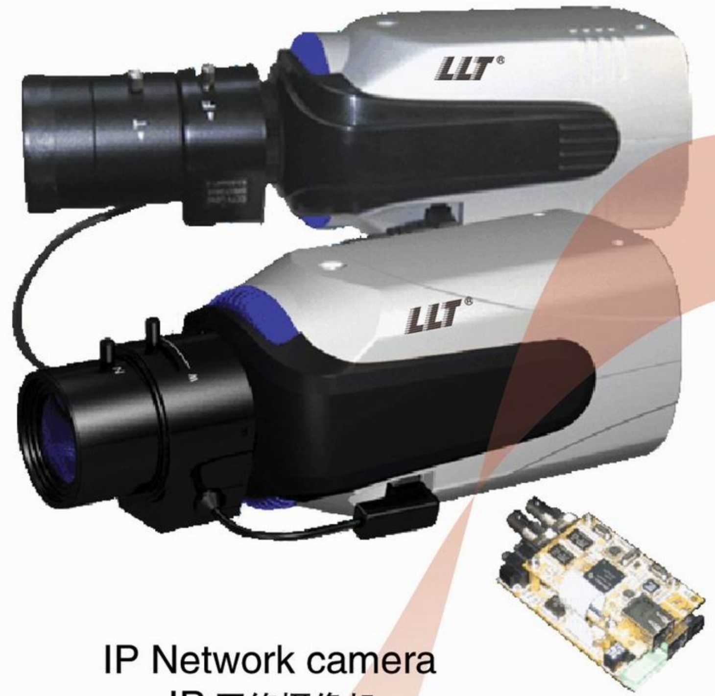
IP Network camera IP 网络摄像机